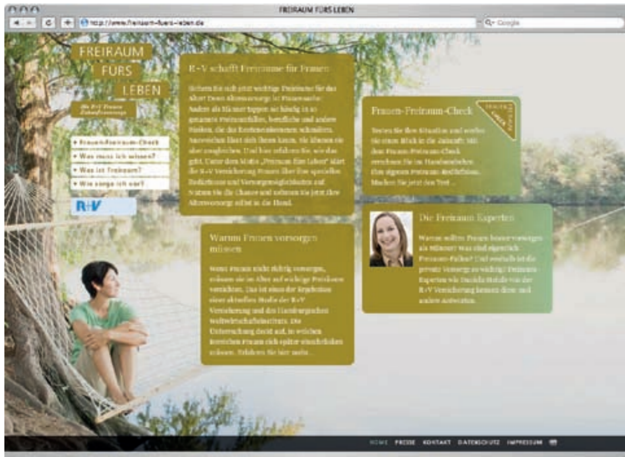
Von der Freiraum-Falle zum Freiraum-Check: Die Website bietet Frauen viel Info und handfeste Tipps zu ihrer individuellen Rentensituation.