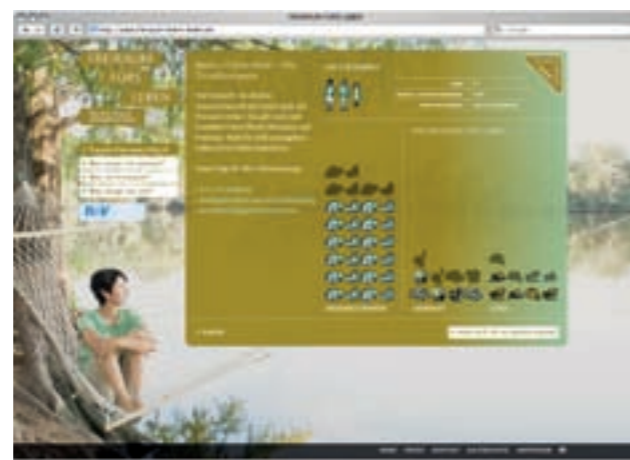
Aha-Effekt: Diese Frau wird im Alter schon bei Lebensmitteln und Wohnen sparen müssen – und noch viel mehr bei ihren Hobbys, der Gesundheit, dem Friseurbesuch.