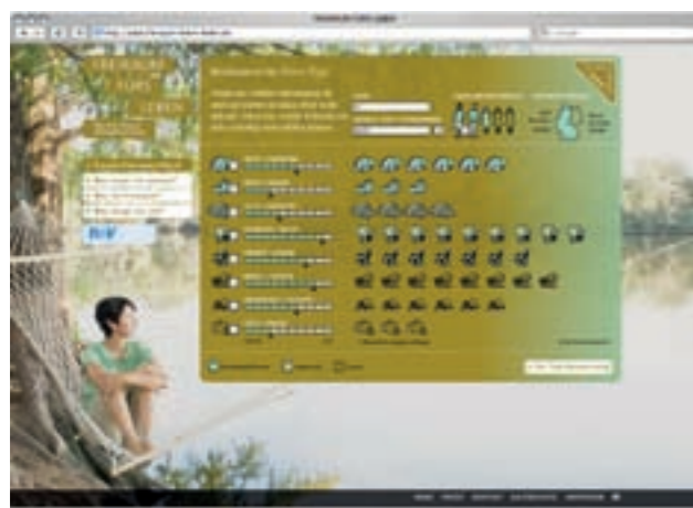
Rentencheck mit Spaßfaktor: Spielerisch werden Konsumtypen ermittelt.