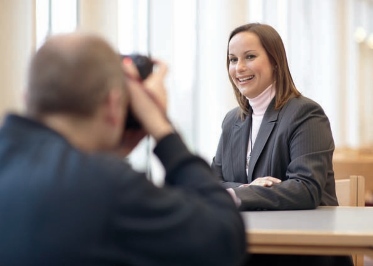
Lächeln für die Presse: Die R+V-Altersvorsorge-Spezialistin beim Fototermin.